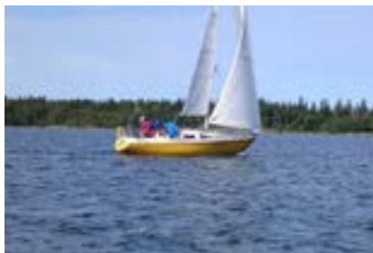
PO och Tollef i la Comtesse.

nygrillad korv förvisades jag till att räkna seglade distanser och korrekationer. Alla var nöjda och hade seglat långt!