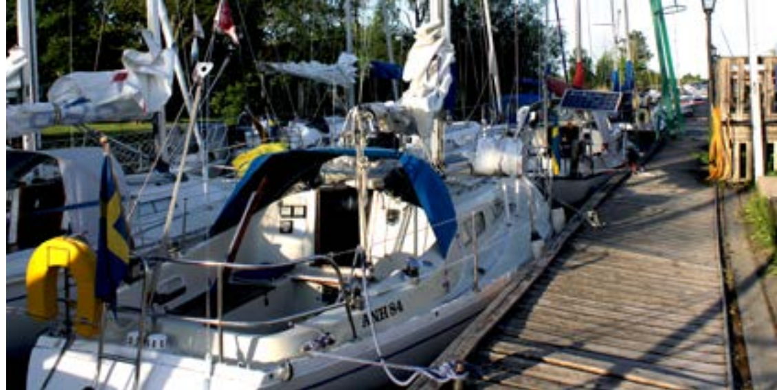
Örsundsbroeskadern vid bryggan.