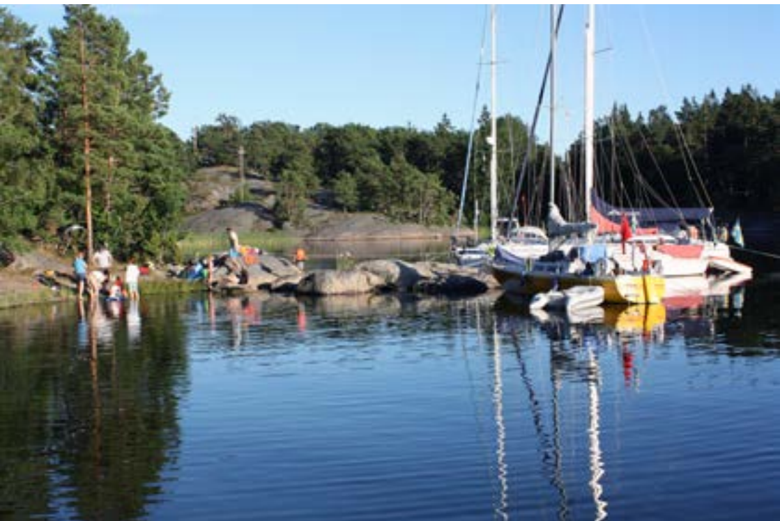
Uppsalakretsens barneskader 2012.

Start vid Rosersbergsviken och avslutning vid Stäket. Färd runt Mälaren med besök vid slott, herresäten och andra platser av natur- eller kulturhistoriskt intresse. Några av uppehållen blir Grönsöö slott (Granskär), Västerås, Sundbyholm, Strängnäs och Mariefred (med Gripsholms slott). Kölavgift 200 kr.