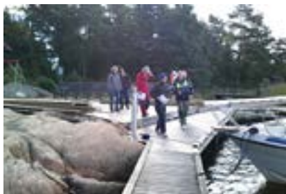
Rusning till båtarna efter skepparmötet.